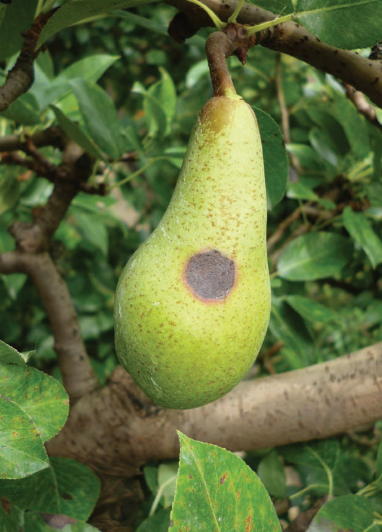
Maculatura bruna su frutto