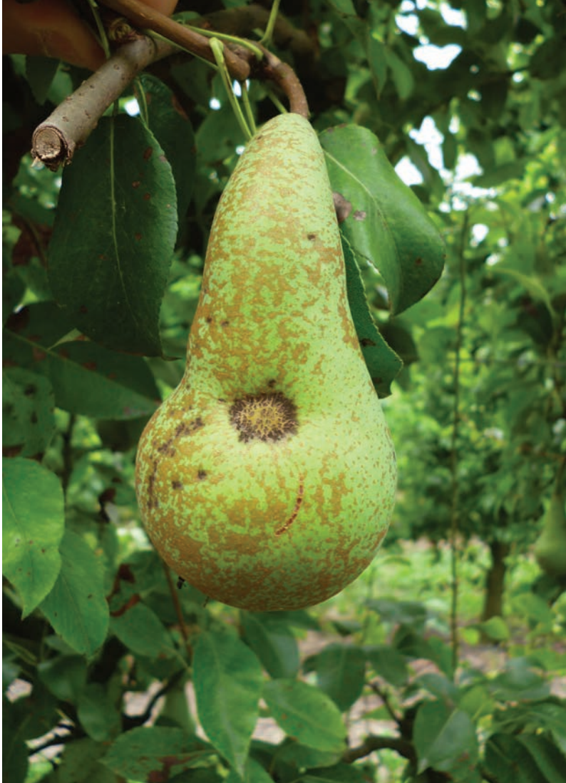
Ticchiolatura su frutto