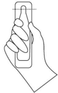
TAGLIARE SEGUENDO IL SEGNO TRATTEGGIATO