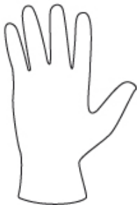
INDOSSARE UN GUANTO MONOUSO